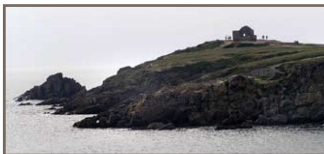
Côte sauvage de la Presqu'île de Quiberon