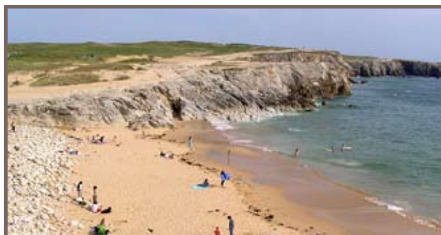
Plage sur la Presqu'île de Quiberon