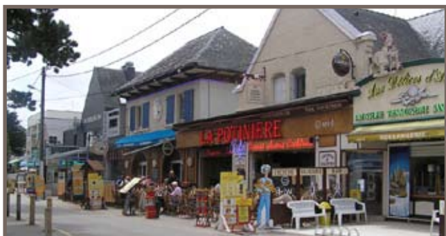
Commerces / Restaurants à Carnac-Plage

Voici quelques clichés de Carnac-Plage (la grande plage, commerces, alignements) et de la Presqu'île de Quiberon (la Côte Sauvage, les plages insolites...)