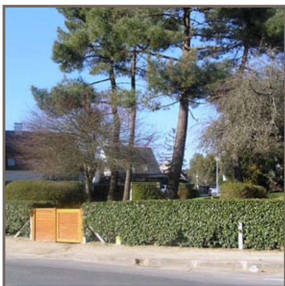
Vue du parc, à l'entrée du lotissement résidentiel.