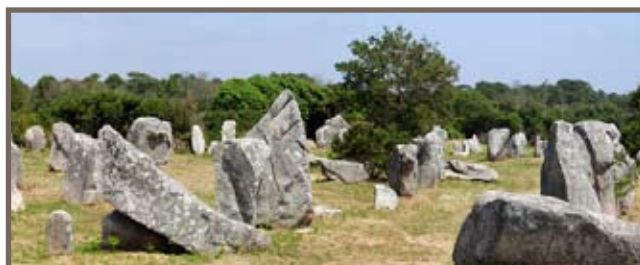
Alignements de Carnac