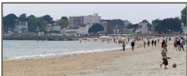
Grande Plage de Carnac